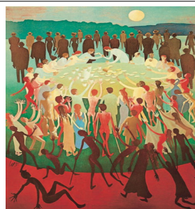
Willy Pries, Das große Gastmahl, 1963